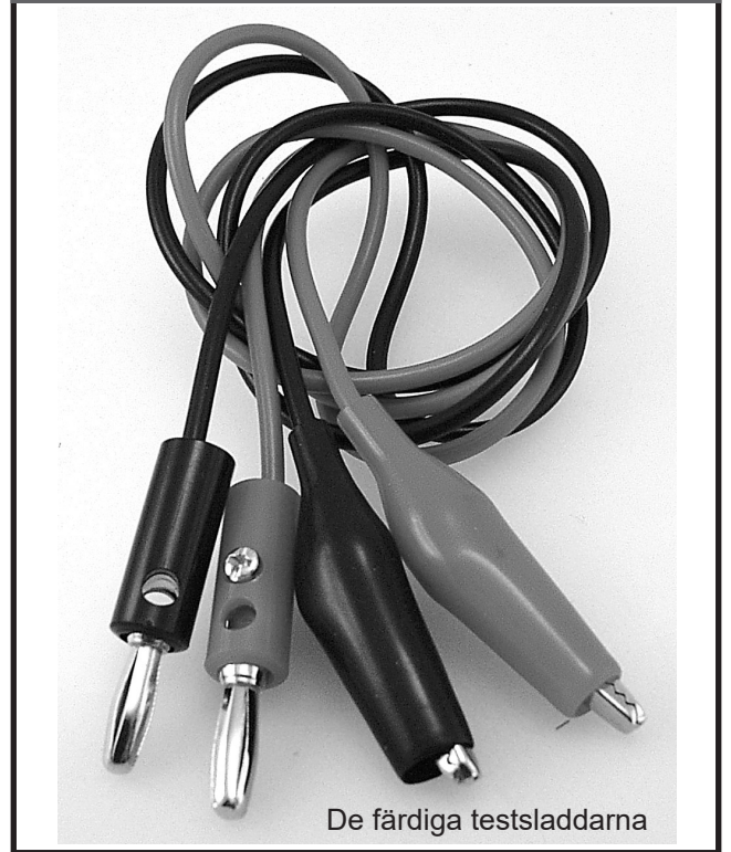
De färdiga testsladdarna