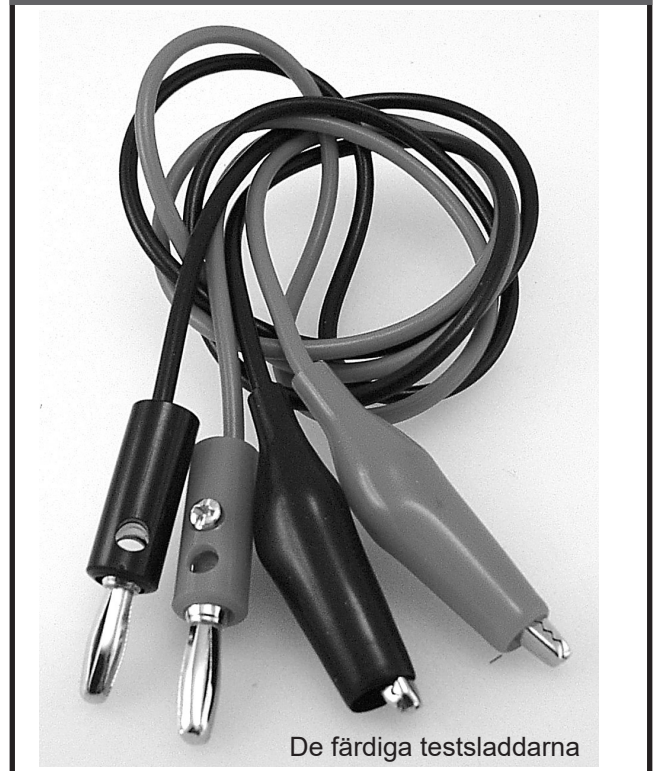
De färdiga testsladdarna