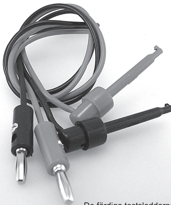
De färdiga testsladdarna