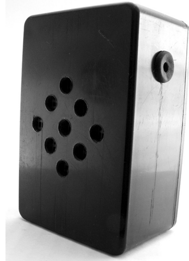
Den färdiga sirenen inbyggd i låda.

Den här kompletteringssatsen är avsedd för byggsatsen Elektronisk siren med IC - BM013.